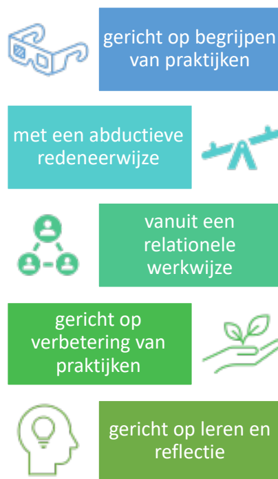
Figuur 2 - Bouwstenen van praktijkgericht onderzoek

We bespraken met alle lectoren een voorbeeld van een onderzoek waar zij trots op zijn en/ of waar zij door geïnspireerd zijn geraakt. De analyse en bespreking hiervan heeft bouwstenen opgeleverd voor het praktijkgericht onderzoek aan de CHE zoals gevisualiseerd in figuur 2 bouwstenen van praktijkgericht onderzoek.